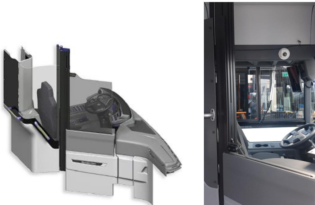
Slika 1.1 Primer voznikove kabine (vrata in steklo čez celotno širino vrat v dvignjenem in v spuščnem položaju)

Ustrezen izgled vozniške kabine na strani, ki je obrnjena proti potnikom, je prikazano na sliki 1.1