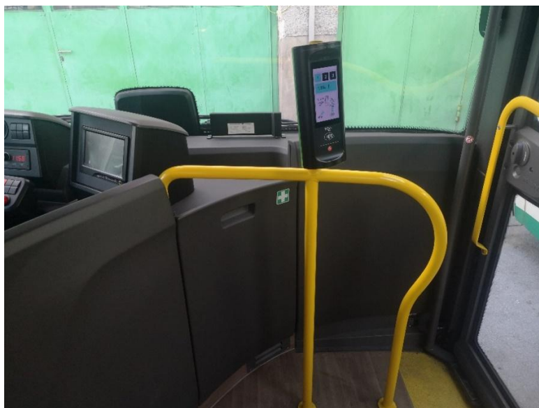
Slika 1.2 Primer oprijemnega droga pri prvih vratih z nosilcem za validator, ter ohišje z nosilcem na armaturni plošči, desno od voznika, kjer se montira Car-PC.

Pri prvih vratih mora biti nameščen oprijemni drog z nosilcem za validator, kot je prikazano na sliki 1.2